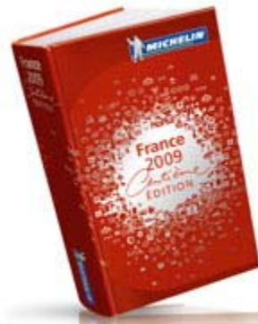
100周年を迎えたフランス版ミシュランガイド

ミシュラン・レストランガイドのフランス版は、今年100周年を迎えた。かつては400ページだったガイドが、いまでは2000ページ。紹介されている3531のレストランのうち、548カ所に星がついている。(三つ星26、二つ星73、一つ星449)。日本人シェフが経営するレストランでは、ローヌ地方のフレンチ料理店「ラカシェット」が一つ星を獲得。これで、本場フランスで星を獲得した日本人シェフは6人になる。