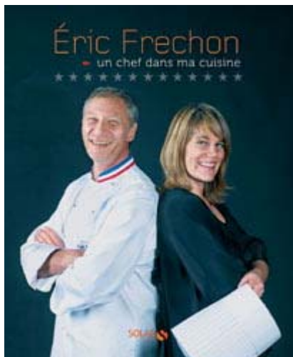
3月12日に出版されるシェフのレシピ集(「Un chef dans ma cuisine」Solar Editions)

高級料理を作ってきた経験をプロだけでなく一般の人々にも伝えようと、まもなく家庭でも作れる料理の本が出版される。現在、一緒に住んでいるパートナーと共同で執筆したレシピ集。シェフ秘伝のレシピを彼女がだれにでも作れるようにシンプルに説明したもの。超簡単に作れるという100種類以上の料理方法が掲載されている。三つ星レストランにはなかなか行く機会がないが、なんだか三つ星シェフが身近に感じる。