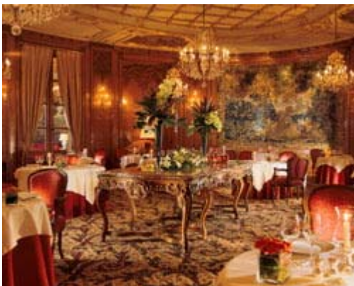
三つ星に昇格した「ル・ブリストル」

今年、三つ星に昇格したパリ8区の高級ホテル「ルブリストル」のレストラン。シェフは、ノルマンディー出身のエリック・フレション氏(45)だ。大統領府に近いことから、サルコジ大統領もしばしば食事にくる。大統領のお気に入りにはマカロニのファルシ(詰め物)、トリュフ添え。イギリスのトニー・ブレア前首相やエジプトのムバラク大統領ともここで会食した。